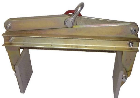
Abbildung 1 Gesamtansicht Plattengreifer R 1000 Jumbo