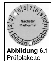
Abbildung 6.1 Prüflakette